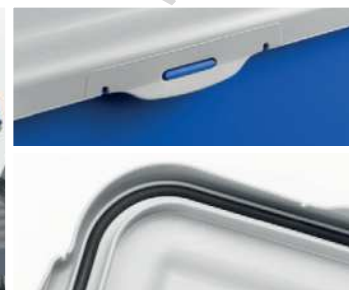
Aggancio al secchio e guarnizione ermetica