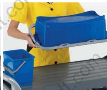
Distribuzione uniforme della soluzione