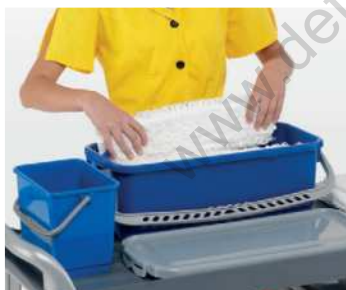
Posizionamento dei ricambi