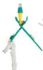
Blik & Wet Disinfection