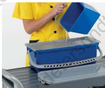
Dosaggio soluzione chimica