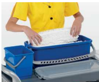
Posizionamento dei ricambi