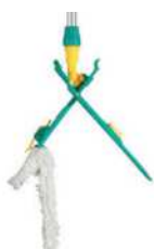
Blik & Wet Disinfection