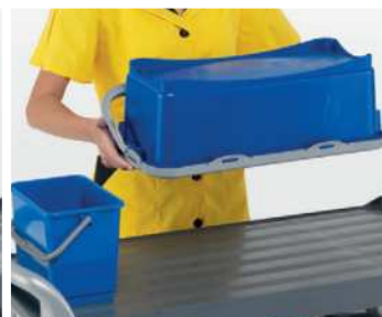
Distribuzione uniforme della soluzione