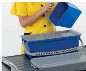
Dosaggio soluzione chimica