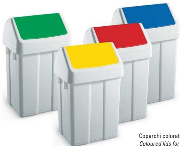
Coperchi colorati per raccolta differenziata Coloured lids for waste collection