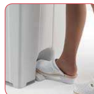
Con Pedale With pedal