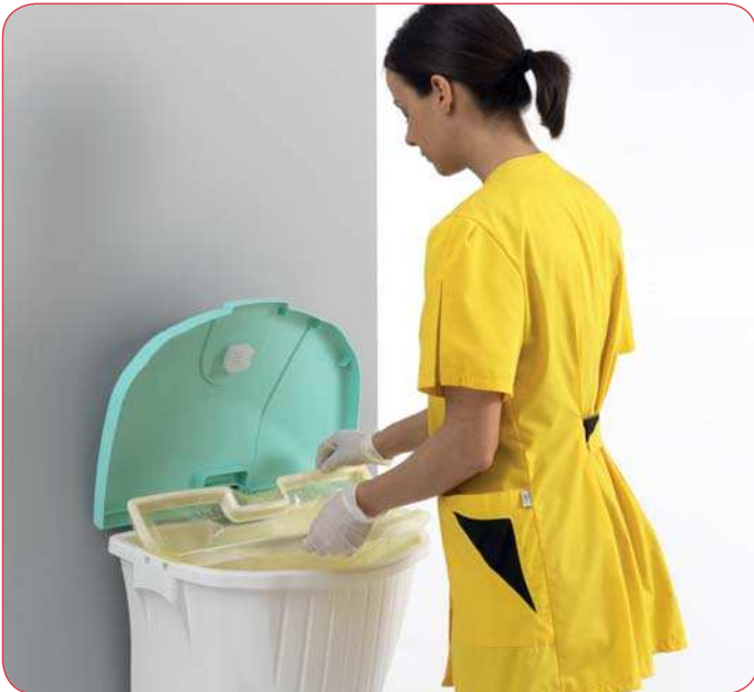
Doppio anello tendisacco - Equipped with 2 bag-tightening bars