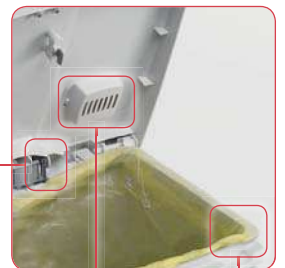
Vaschetta per pastiglia Sanydeol Basin for Sanydeol tabs

Ammortizzatori SHHUT System (SET 2 pezzi) SHHUT System Buffers (SET 2 pieces) accessorio / accessory