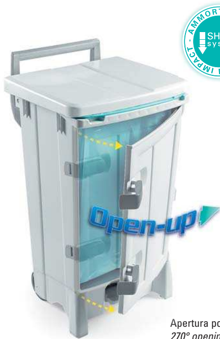
Apertura porta a 270° 270° opening door