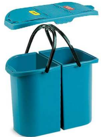
Art. 00005450 DISCOVERY 11 L + 11 L