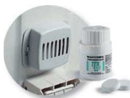
Art. 00005680 Compre Sanydeol igroscopiche cloroattive ad azione sanificante e deodorante Hygroscopic Chlorion Tabs Sanydeol to sanitize and deodorize

accessori Open-Up 90 L e Derby 90 L - accessories Open-Up 90-L and Derby 90-L