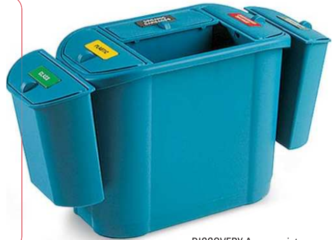
DISCOVERY Accessoriato DISCOVERY Bin with accessories

Ideale per la raccolta differenziata Ideal for waste collection