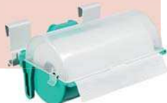
Art. S070230 Porta-carta chiuso Closed paper-holder