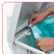
Ganci tendisacchetto Hook for plastic bag