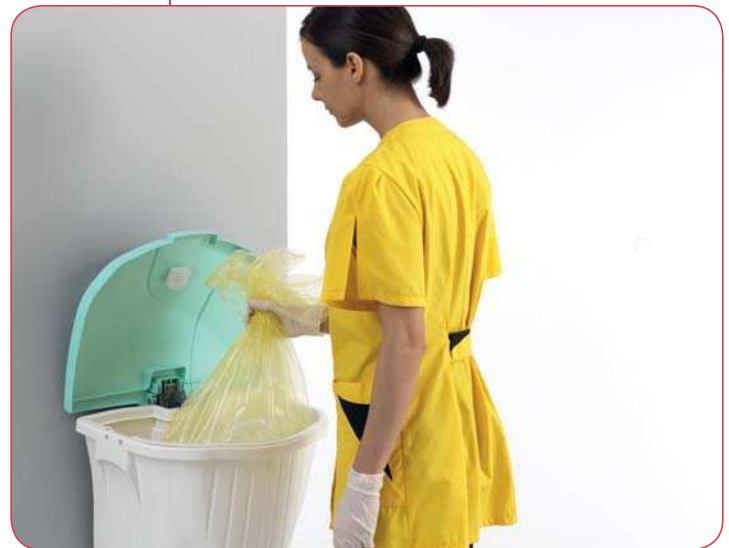
Sacco consigliato - Bag recommended 70x80cm