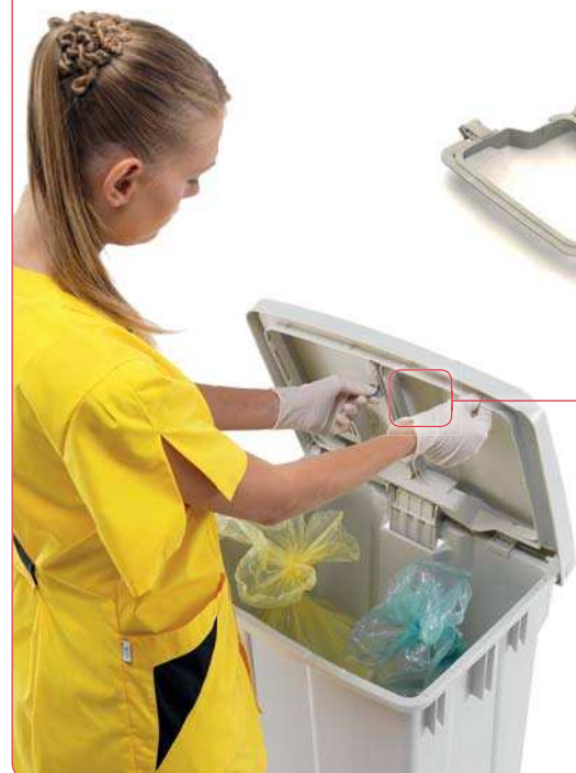
Blocco anello tendisacchetto Ring lock for plastic bag

Ideale per la raccolta differenziata Ideal for waste collection