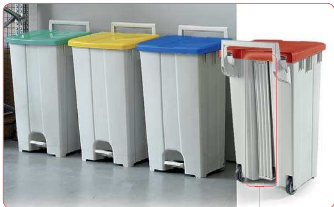
Coperchi colorati per raccolta differenziata Coloured lids for waste collection