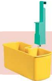
Art. 00003340 Vaschetta portaoggetti Plastic basin